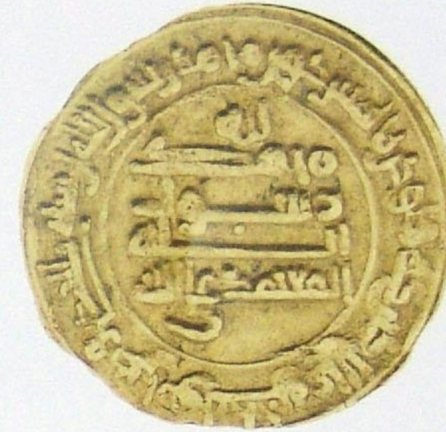
دينار عباسي المعتد على الله ضرب: سمرقند سنة: ٢٧٣ هجري

Abbasids Dinar Al Moetemed Ala Allah struck at Samarqand Year: 273 H